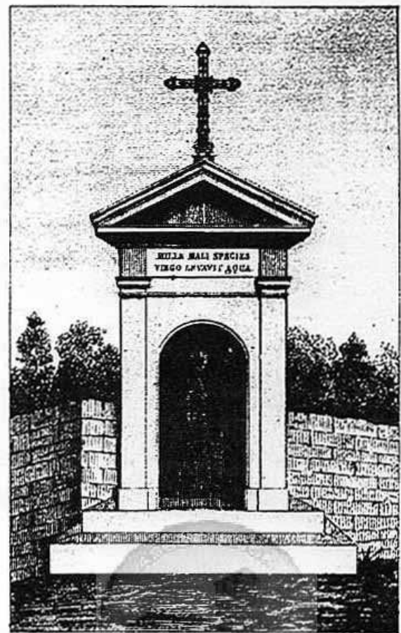
FONTAINE MIRACULEUSE DE N-D DE MARCELLE